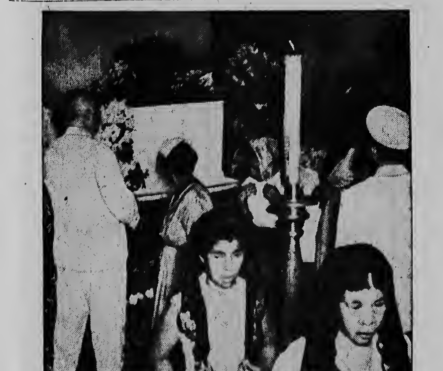
Velen, uit alle lagen en standen der bevolking, kwamen een laatste afscheid nemen van hun vermoorde President, JOSE ANTONIO REMON, van Panama

OSLO.— Het kabinet van de Noorse premier heeft bekendgemaakt, dat Oscar Torp aftreedt als premier van de socialistische regering. Hij zal koning Haakon adviseren de leider van de socialistische parlementsfractie, Gerhardsen, tot premier te benoemen.